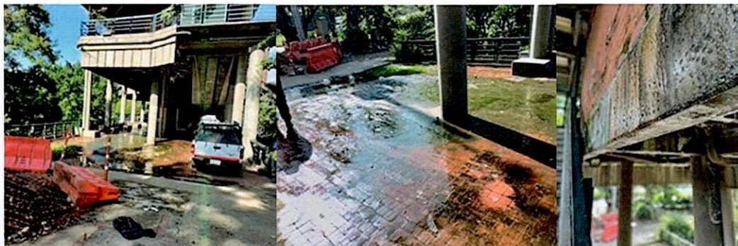
Imagen deterioro Aula Ambiental