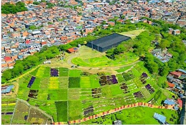
Jardín Morro Moravia 2014

Fuente. Distrito de Medellín y Artículo producto de Investigación "Moravia como ejemplo de transformación de áreas urbanas degradadas: Tecnologías apropiadas para restauración integral de cuencas hidrográficas." Cátedra UNESCO de Sostenibilidad, Universidad Politécnica de Cataluña, Tecnológico de Antioquia, Institución Universitaria, ONU-HABITAT06/05/2011