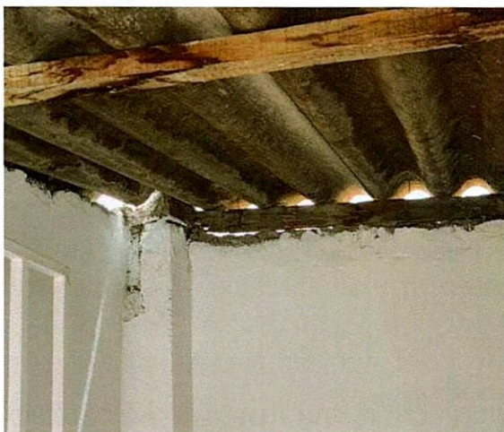
Registro fotográfico primera visita septiembre 27 de 2023