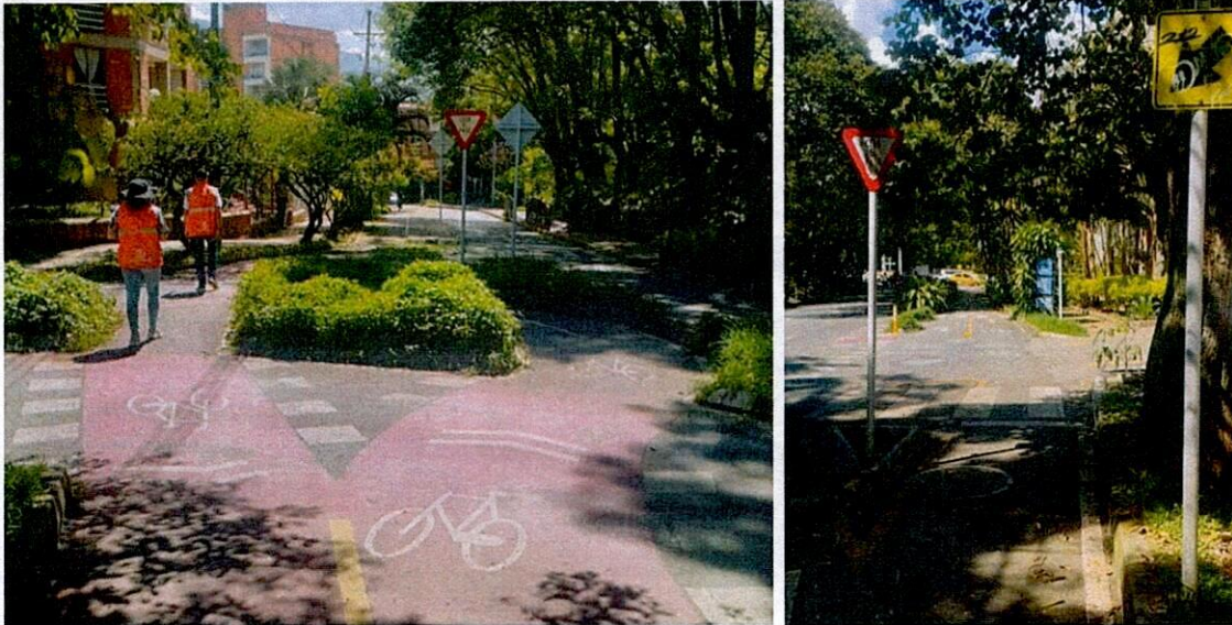
Ilustración 4. Tramo La Picacha Norte - Belén