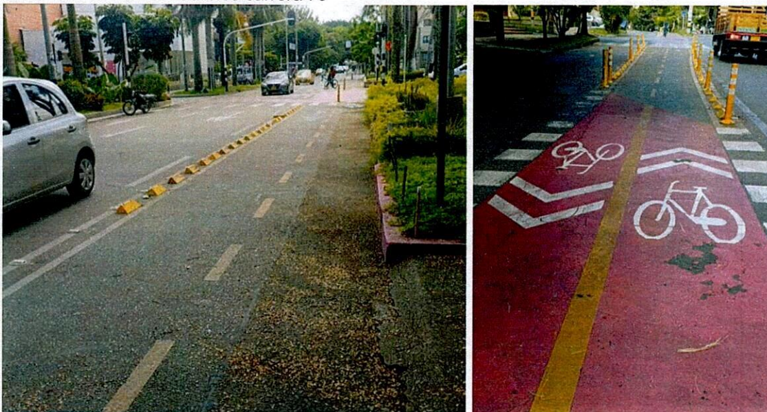
Ilustración 3. Tramo Laureles carrera 76