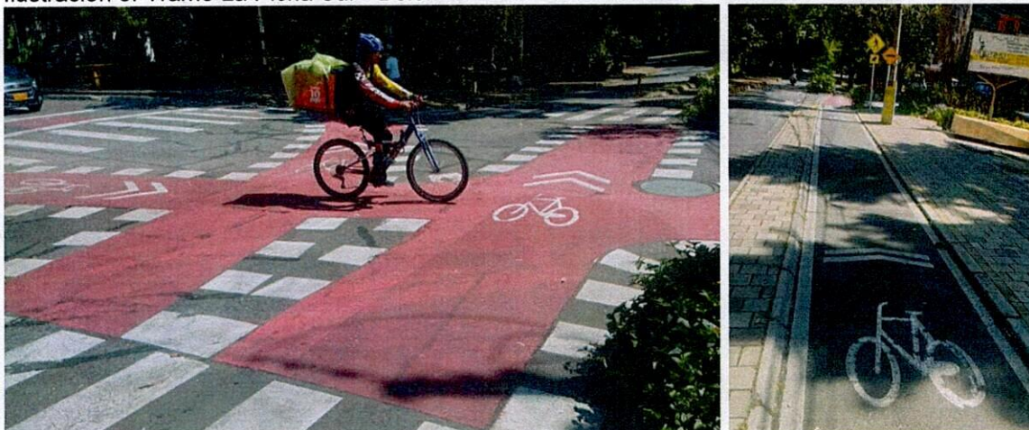
Ilustración 5. Tramo La Picha Sur - Belén