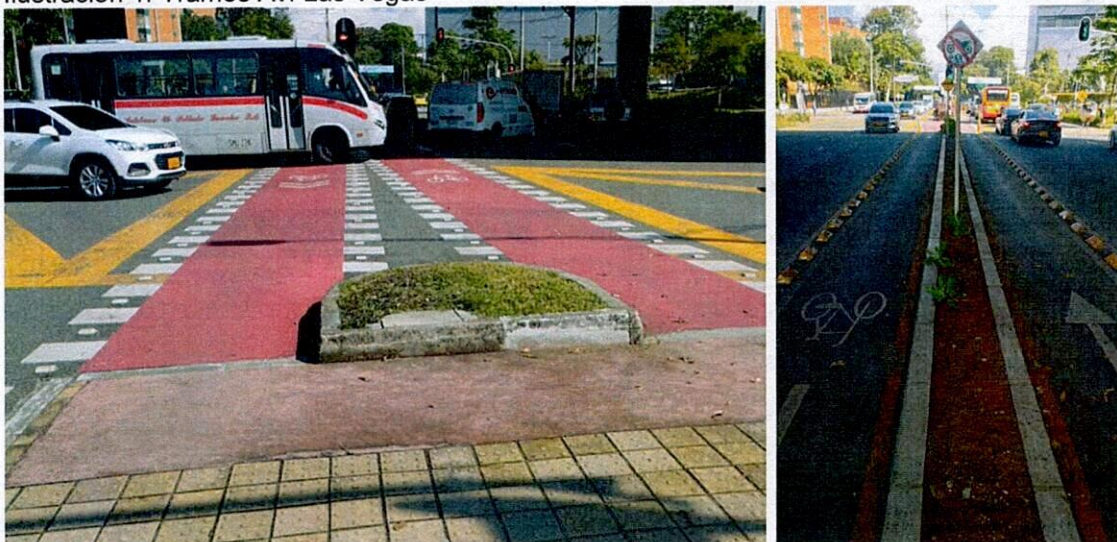
Ilustración 1. Tramos Av. Las Vegas

Durante la vigencia 2022, con los contratos mencionados, se logró la intervención de 32.935 metros lineales de Ciclorrutas, mostrándose un cumplimiento frente a lo planeado en el Plan Indicativo. El Equipo Auditor, durante visita realizada a cinco de los tramos intervenidos verificó la realización de las actividades contratadas, no obstante, se pudo establecer que la frecuencia de mantenimiento en algunos sitios exige una mayor periodicidad, dado que, por ejemplo los tapetes en cruces de alto flujo vehicular se deterioran rápidamente, de igual forma sucede con los segregadores, los cuales son destruidos frecuentemente en los tramos de tránsito compartido. Si bien los trabajos obedecen a una planeación, muchos sitios requieren intervención inmediata frente a situaciones o daños que afectan directamente la Cicloinfraestructura.